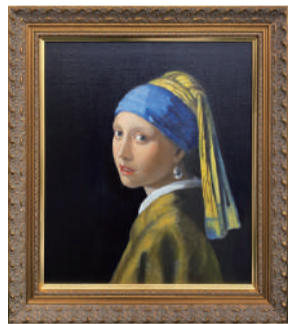
前回講座参加者作品

ポティッチェリやフラアンジェリコが用いたテンペラ技法、レンブラントやフェルメールのグリザイユ技法など、名作の原寸大の模写をとおして油絵に使用する技法を学びます。 表現の幅がグッと広がりますよ！ 制作サイズ：元の作品と同じサイズで制作します